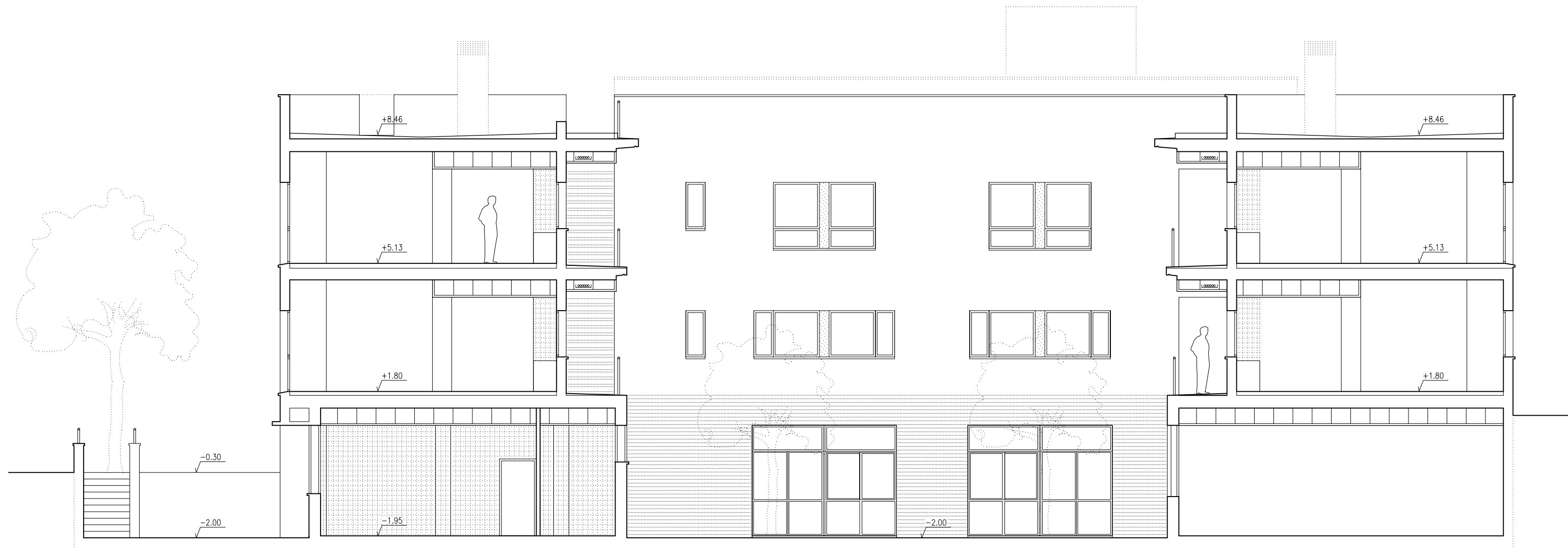
Sección transversal F-F'